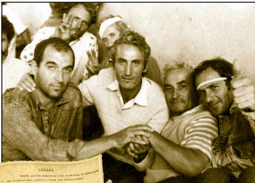
Në foto: (Majtas) Dita e parë e greves së urisë, 21.9 (Poshtë) Një grup i grevisteve të urisë me 25.9