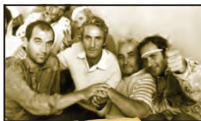
Në foto: Grevistë e urisë më 1991 dhe një faksimile e lista e te burgosurve politik qe u futen ne greve urie

Shkodër. Menjherë të binte në sy vorfnia e ambientit, që përveç do stolave a karrigave të vjetra, në zyrën e „kryetarit“ gjindej një tryezë e vjetër mbi të cilën qe vendosë një makinë shkrimit dhe vula e re e shoqatës të sapokrijume antikomuniste.